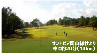
サントピア岡山総社より 車で約20分(14km)