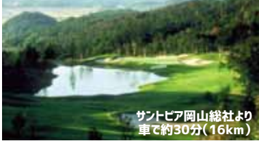
サントピア岡山総社より 車で約30分(16km)