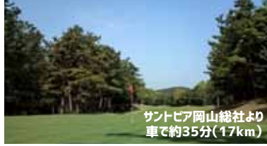
サントピア岡山総社より 車で約35分(17km)