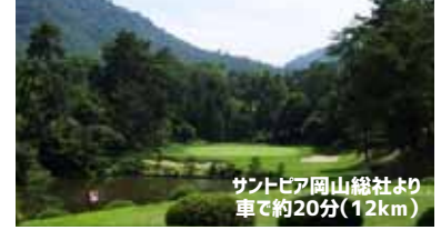
サントピア岡山総社より 車で約20分(12km)