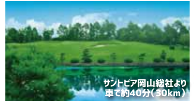
サントピア岡山総社より 車で約40分(30km)